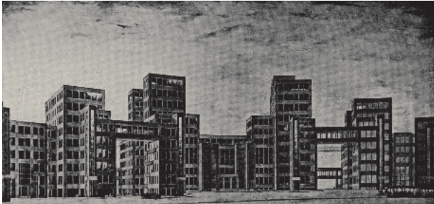
Derzhprom-Komplex am Platz der Freiheit in Kharkiv – Entwurfszeichnung, 1925

Der Krieg gegen die Ukraine bringt unfassbares Leid über die Menschen und zerstört Infrastrukturen und Kulturgüter. Die Baukultur der Moderne ist besonders betroffen. Aus diesem Anlass findet zur Triennale der Moderne 2022 in Berlin ein Themen-Schwerpunkt zu den Wurzeln und dem Erbe der Moderne in der Ukraine anhand von Kharkiv und Lviv statt.